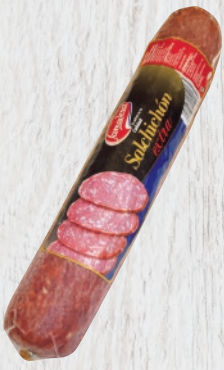
Salchichón Extra Cod. 21417 Unidad de 1,7 kg aprox. Cajas de 4 unidades