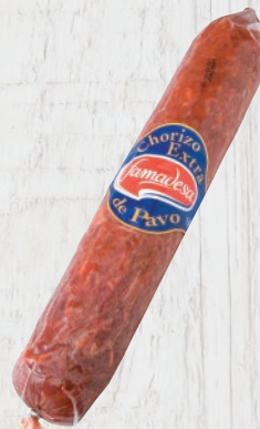
Chorizo Extra Pavo Cod. 21447 Unidad de 1,7 kg aprox. Cajas de 4 unidades