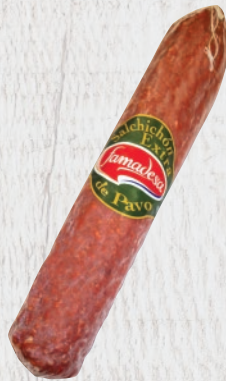
Salchichón Extra Pavo Cod. 21448 Unidad de 1,7 kg aprox. Cajas de 4 unidades