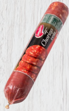
Chorizo Vela Cod. 21440 Unidad de 1,35 kg aprox. Cajas de 4 unidades