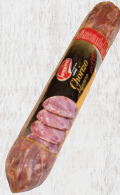
Chorizo Blanco Extra Cod. 21421 Unidad de 1,7 kg aprox. Cajas de 4 unidades