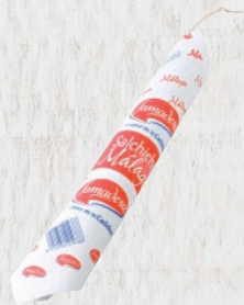
Salchichón Málaga Extra Cod. 21418 Unidad de 250 g aprox. Cajas de 5 kg aprox.