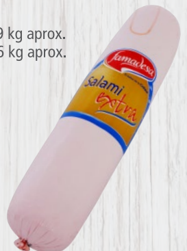
Salami Extra Blanco Cod. 21446 Unidad de 2 kg aprox. Cajas de 2 unidades