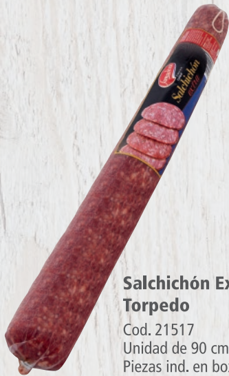
Salchichón Extra Torpedo Cod. 21517 Unidad de 90 cm aprox. Piezas ind. en box