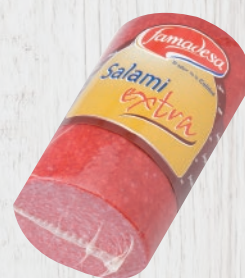
Salami Extra medias piezas Cod. 21414 Unidad de 2 kg aprox. Cajas de 2 unidades