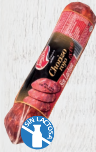
Chorizo Rojo Extra Sin Lactosa Cod. 21492 Unidad de 330 g aprox. Cajas de 12 unidades