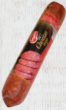
Chorizo Rojo Extra Cod. 21422 Unidad de 1,7 kg aprox. Cajas de 4 unidades