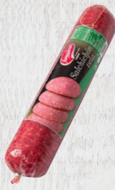
Salchichón Vela Cod. 21441 Unidad de 1,35 kg aprox. Cajas de 4 unidades