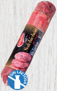
Salchichón Extra Sin Lactosa Cod. 21497 Unidad de 330 g aprox. Cajas de 12 unidades