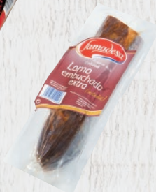
Lomo Embuchado extra mitades Cod. 21444 Unidad de 800 g aprox. Cajas de 5 a 6 kg aprox.